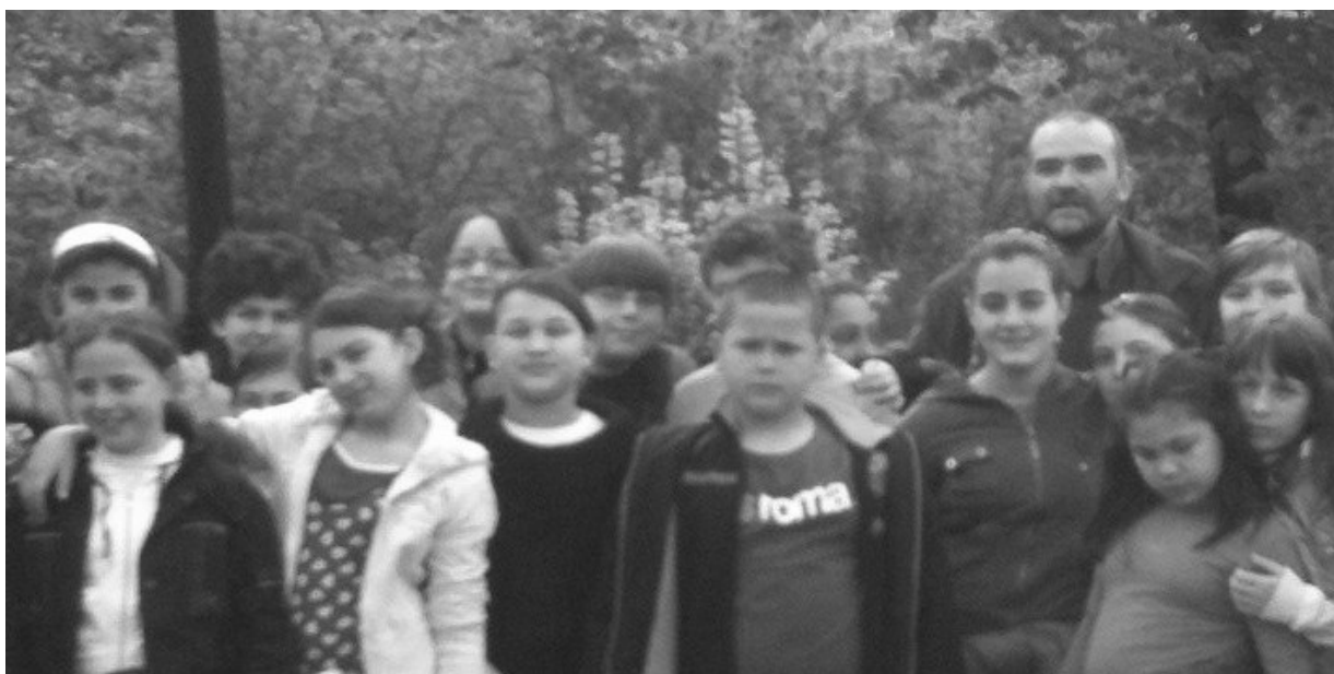
Bambini e insegnanti in visita al Parco Somaini

Inoltre anche le somme date dai genitori e i modi di spendere il denaro sono i più diversi.